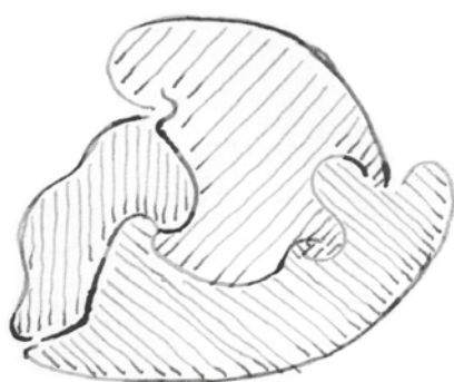
RUDOLF STEINER, Entwurf für die Schluss-Vignette unter dem Aufsatz ›Geistesleben, Rechtsordnung, Wirtschaft‹ 1919

RUDOLF STEINER, 15. August 1919, ›Die Erziehungsfrage als soziale Frage‹, GA 296