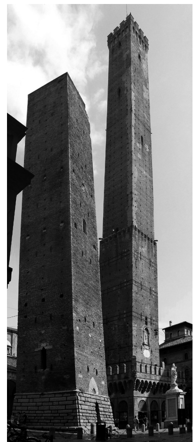
Geschlechertürme in Bologna

In Bologna muss das jedoch aus einer erweiterten Perspektive beurteilt werden. Da erklingt eine Vielzahl an wertschätzenden Lobreden, die aufgrund des inhaltlichen Unterbaus zum Teil durchaus überraschend wirken. So viel Zustimmung zu Rudolf Steiner war nie und nirgends.