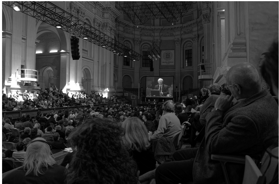
Blick in den Kongress-Saal der Universität Bologna

Hier kann nur ein übendes Verhältnis zu den eigenen Erlebnissen, d. h. zum eigenen Leben die Lösung bringen. Ernst zu nehmen, was einem begegnet. Durch treues Zurückkommen